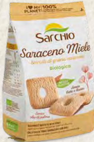
BUCKWHEAT BISCUITS WITH HONEY GALLETAS DE TRIGO SARRACENO CON MIEL