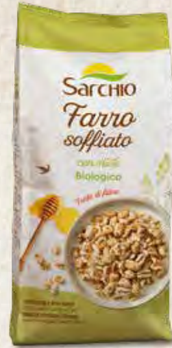
PUFFED SPELT WITH HONEY ESPELTA HINCHADA CON MIEL