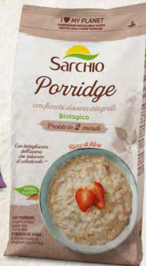
OAT PORRIDGE PORRIDGE DE AVENA