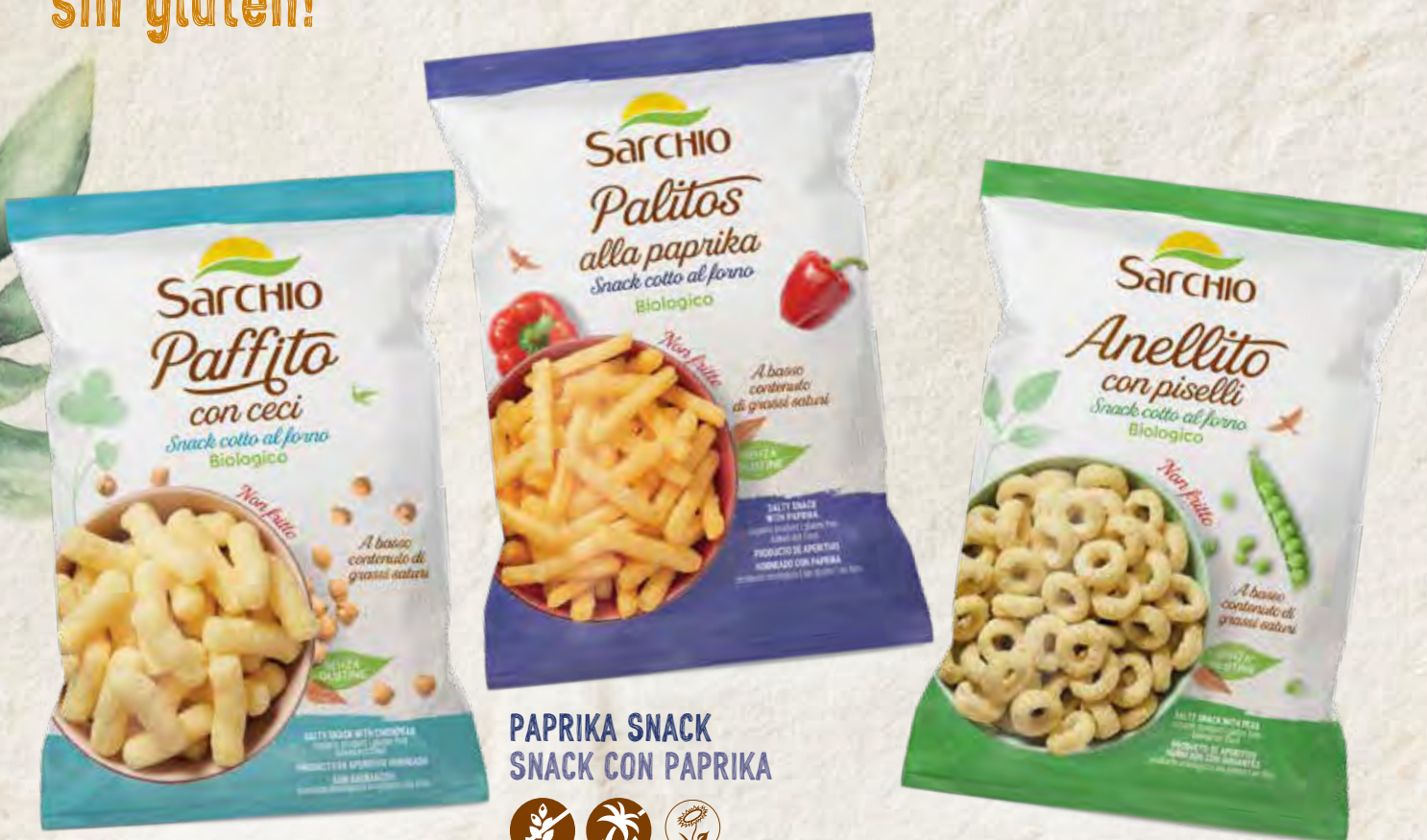
CHICKPEA SNACK GANCHITOS CON GARBANZOS

IRRESISTIBLES Y CRUJIENTES, horneados y preparados con materias primas sin gluten!