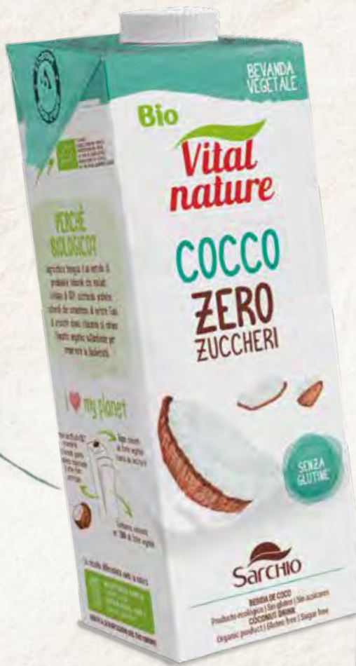
COCONUT DRINK SUGAR FREE BEBIDA DE COCO SIN AZÚCARES

Vegetales y sin gluten , para el desayuno o para utilizar como ingrediente para cocinar.