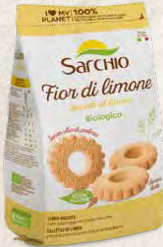
LEMON BISCUITS GALLETAS DE LIMÓN