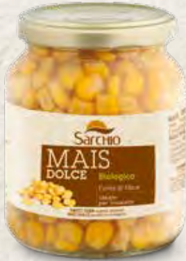
SWEET CORN MAÍZ DULCE