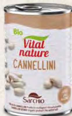
CANNELLINI BEANS FRIJOLE CANNELLINI