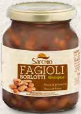
BROWN BEANS FRIJOLES BORLOTTI