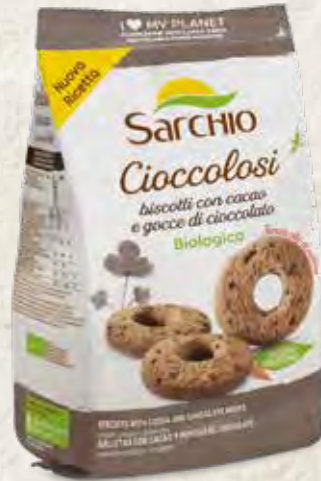
BISCUITS WITH CHOCOLATE DROPS GALLETAS CON PEPITAS DE CHOCOLATE