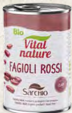
RED BEANS FRIJOLE ROJOS