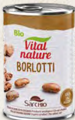
BROWN BEANS FRIJOLE BORLOTTI