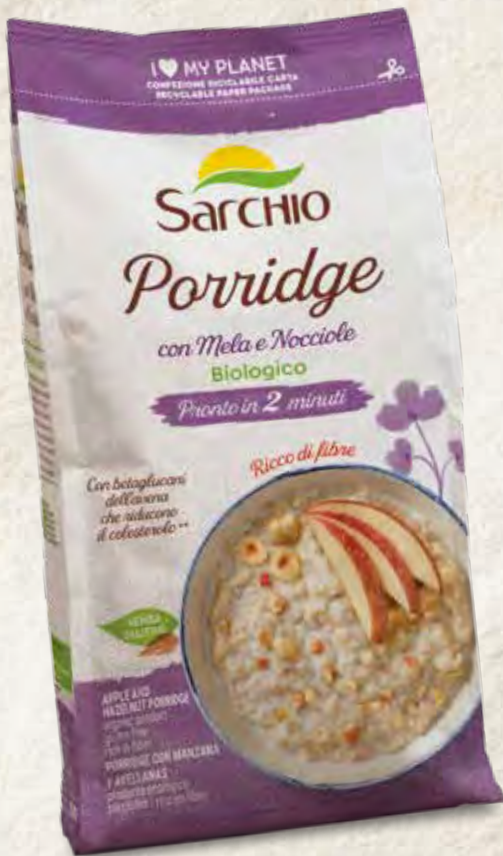
APPLE AND HAZELNUT PORRIDGE PORRIDGE CON MANZANA Y AVELLANAS