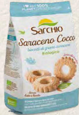
BUCKWHEAT BISCUITS WITH COCONUT GALLETAS DE TRIGO SARRACENO CON COCO