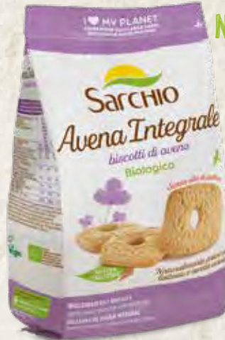
WHOLEGRAIN OAT BISCUITS GALLETAS DE AVENA INTEGRAL