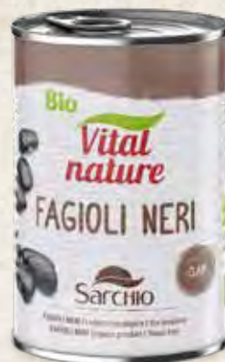
BLACK BEANS FRIJOLE NEGROS