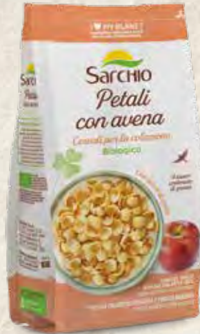
CRUNCHY SHELLS WITH OAT AND APPLE JUICE PÉTALOS CRUJIENTES CON AVENA Y ZUMO DE MANZANA