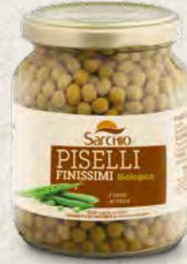
PEAS GUISANTES EXTRAFINOS